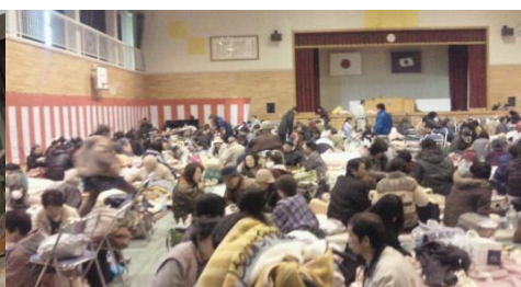
避難所の様子