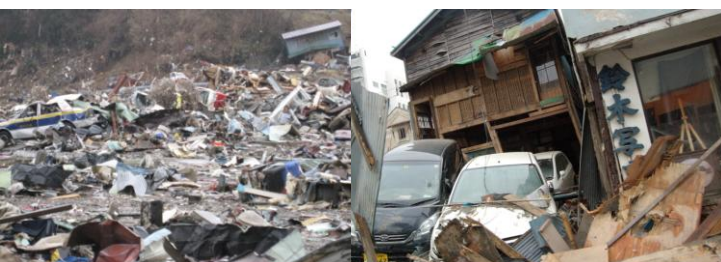
宮城県石巻市の様子