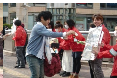
三軒茶屋駅前での街頭募金の様子